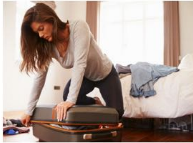
Kein Wunder, wenn die Verdauung rebelliert Der ganz normale Vor-Urlaubs-Wahnsinn