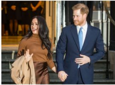
Britisches Königshaus Royals: Harry und Meghan ziehen sich zurück